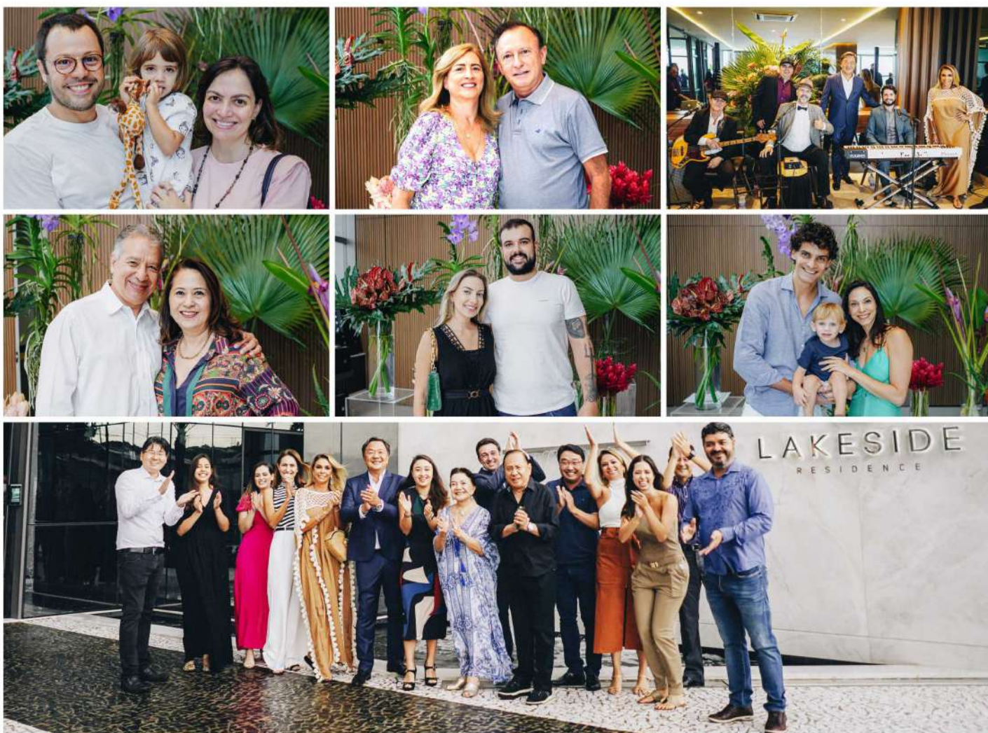
Show de luzes, apresentação musical e coquetel marcam a entrega do Lakeside, que reuniu moradores, parceiros e a diretoria do Grupo A.Yoshii.

As grandes aberturas envidraçadas conectam o empreendimento à uma vista privilegiada da cidade. O projeto oferece soluções para redução de impacto ambiental, visando ao melhor aproveitamento do Sol e da ventilação natural, bem como o reaproveitamento da água da chuva. ■