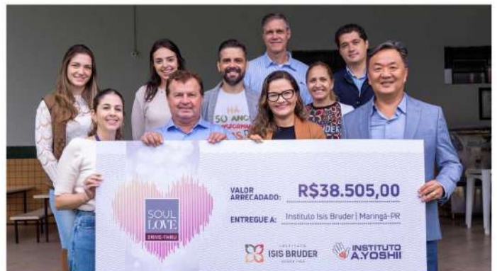
Entrega para o Instituto Isis Bruder do valor arrecadado no Soul Love.