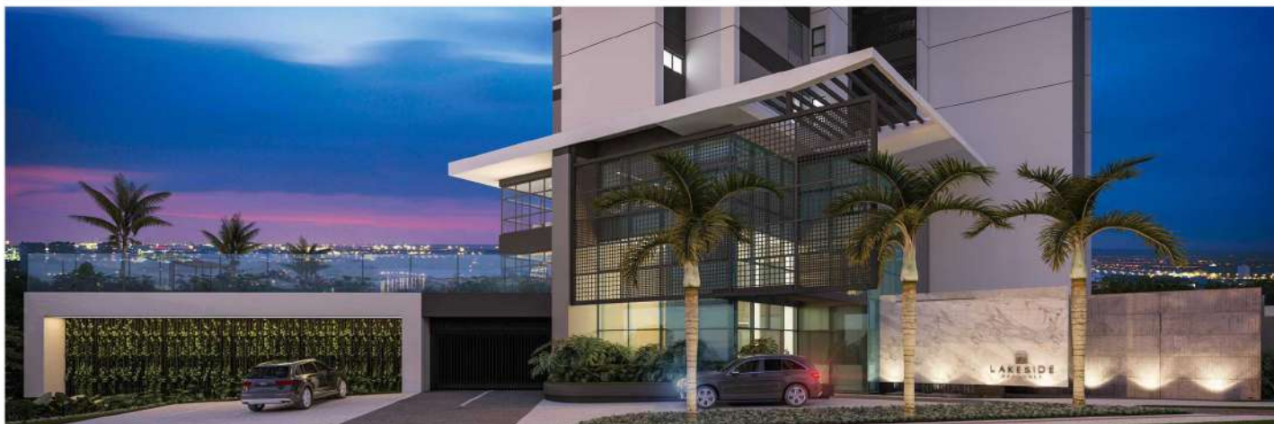
Lakeside se destaca, no Jardim Bela Suíça, em Londrina, pelas cores e traços contemporâneos e pelas aberturas envidraçadas.

O Grupo A.Yoshii entregou o primeiro empreendimento no Belo Suíça, um dos bairros mais cobiçados de Londrina e que passa por uma intensa expansão vertical. O empreendimento, localizado na Avenida Adhemar de Barros, proporciona uma belíssima visão para o Lago Igapó e o centro. Os moradores terão a comodidade de um comércio variado e ótimo acesso às principais vias da cidade.