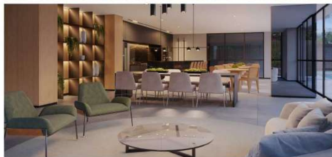
Piscina interna aquecida, quadra de beach tennis e salão gourmet.