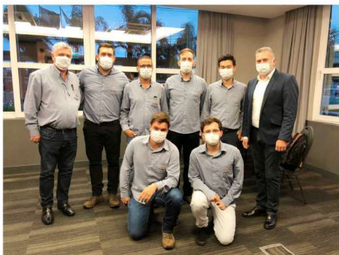
Equipe de profissionais da A.Yoshii que atende a CMPC.

O Grupo A.Yoshii está realizando, desde a segunda quinzena de dezembro, mais uma obra no setor de Celulose e Papel. A empresa, uma multinacional chilena, produz mais de dois milhões de toneladas de celulose, matéria-prima biodegradável utilizada na fabricação de produtos de higiene pessoal, embalagens e vários outros itens presentes no cotidiano das pessoas.