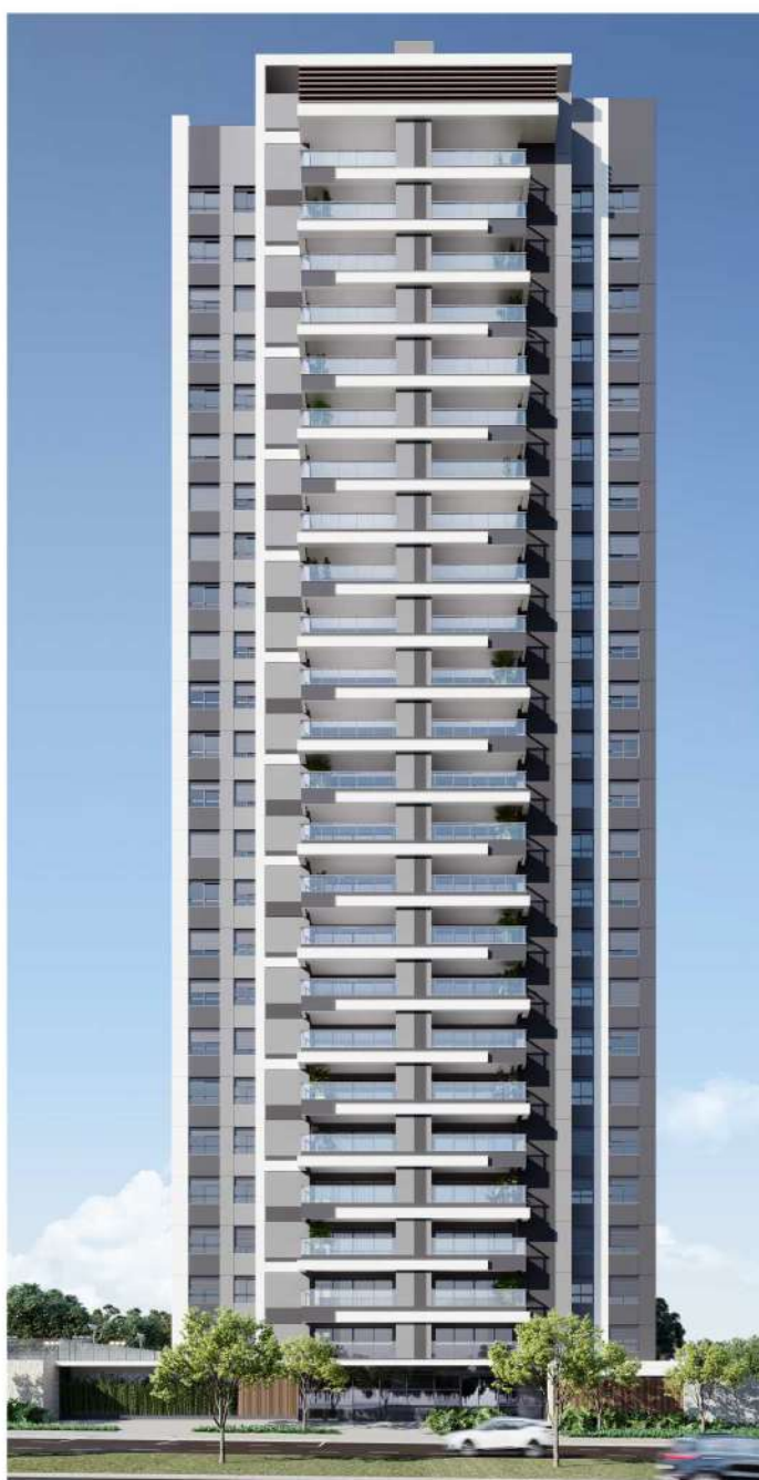
Atmosphere, empreendimento de alto padrão na Zona 3, em Maringá.

EMPREENDIMENTO NA ZONA 3 CONQUISTA CLIENTES AO OFERECER CONFORTO E REQUINTE EM UMA DAS ÁREAS MAIS DESEJADAS DA CIDADE