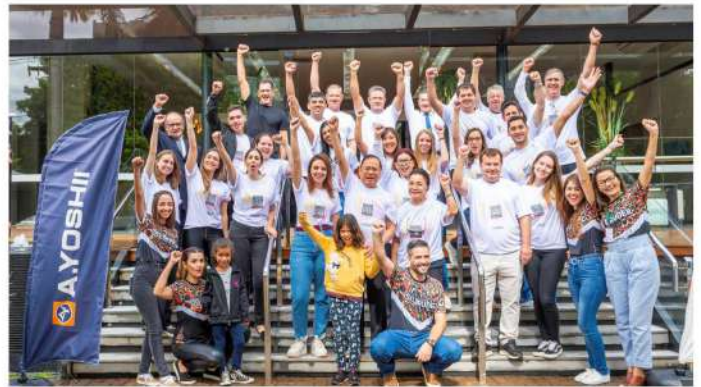
Equipes do Institutos A.Yoshii e Isis Bruder durante o evento Soul Love.

O Instituto Isis Bruder, com mais de 50 anos de história, é referência no atendimento a crianças e adolescentes do município de Maringá. Por meio do Serviço de Convivência e Fortalecimento de Vínculos, são proporcionadas atividades esportivas, culturais e recreativas que promovem a convivência, a cidadania e o protagonismo dos educandos. Visando à inserção dos adolescentes no mercado de trabalho, a entidade também oferece o Programa de Aprendizagem, com cursos de capacitação, além de orientação de psicólogos, assistentes sociais e pedagogos. ■