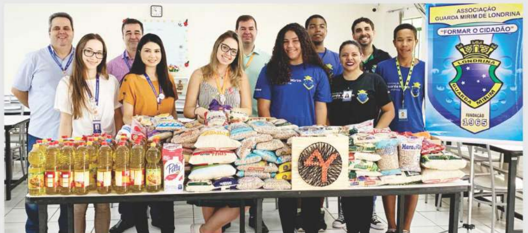
Entrega dos alimentos feita pelo Instituto A.Yoshii à Guarda Mirim de Londrina.