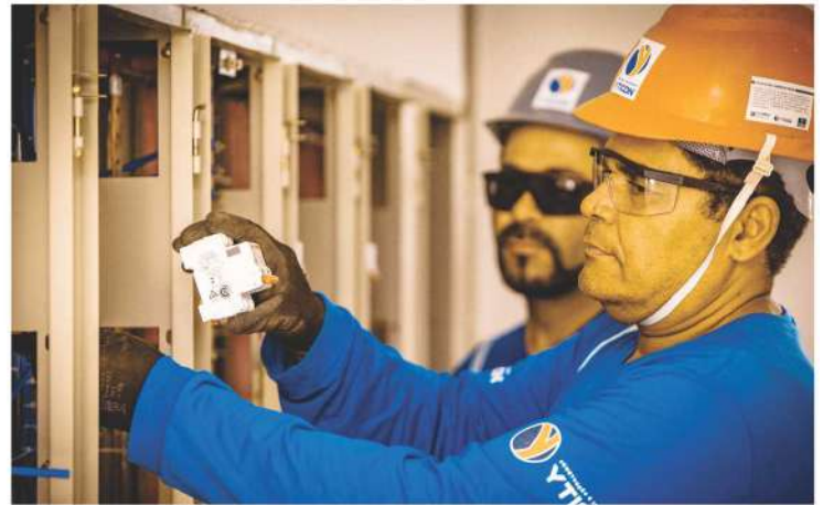
Colaboradores do Grupo A.Yoshii: utilização correta dos EPIS.