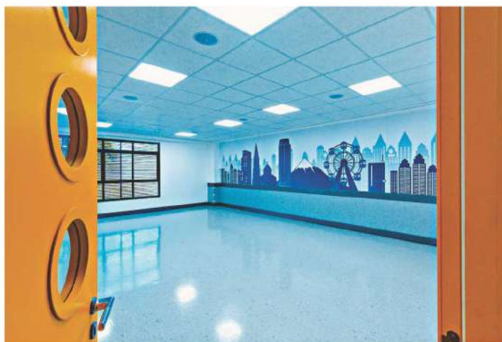
Sala de aula do novo edifício do colégio.