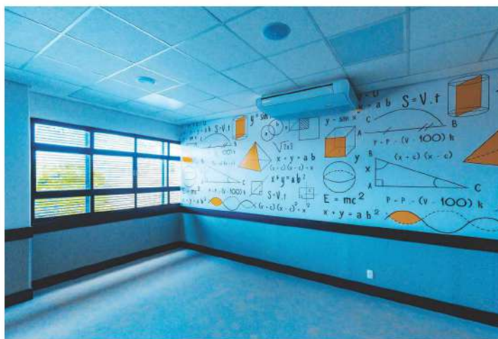
Ambientes modernos e climatizados, uma das novidades do colégio para 2020.

Projetado pela Épya Arquitetura, de Curitiba, o novo edifício do Colégio Positivo – Santa Maria exigiu empenho absoluto dos profissionais da A.Yoshii, tanto pela exiguidade do tempo quanto pelos detalhes: “Os acabamentos são de primeira qualidade, com pisos e paredes em revestimentos vinílicos e porcelanatos. Além disso, todas as áreas e os ambientes foram idealizados de acordo com a idade dos alunos, como o playground coberto e a sala de luzes”, explica a engenheira. ■