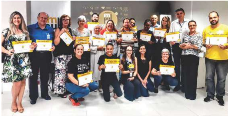
Premiados do Programa Impulso.