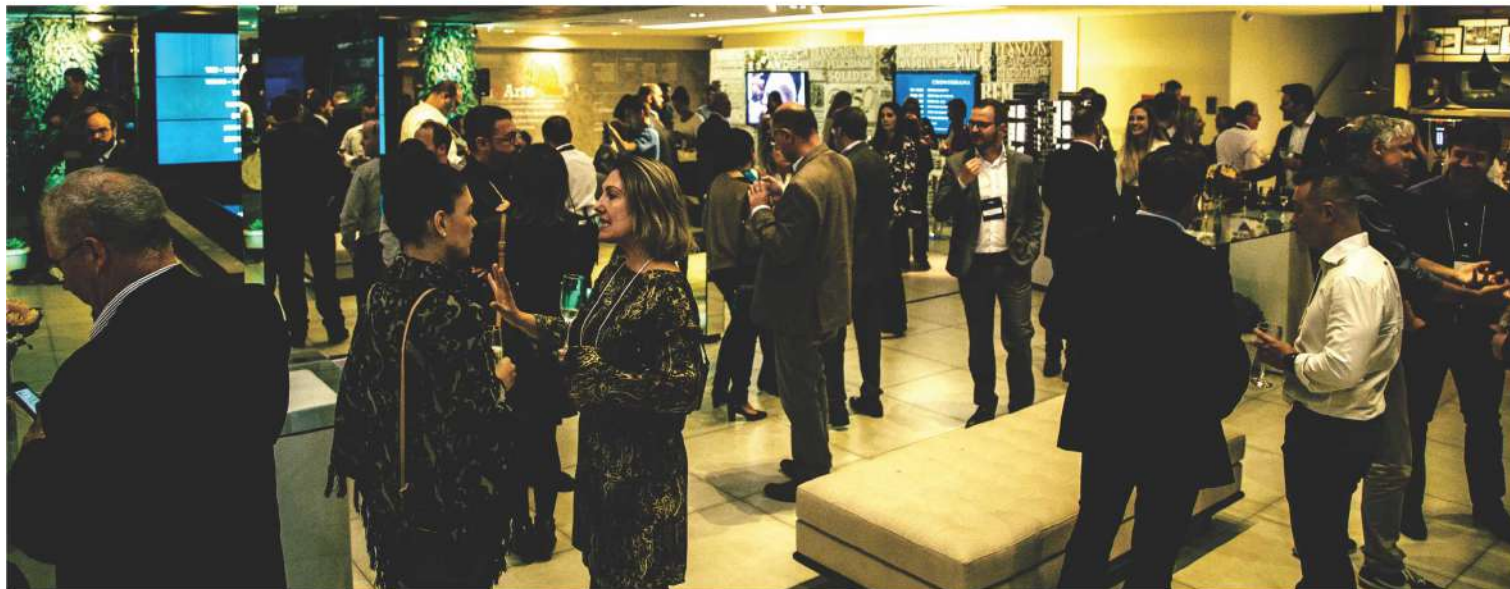
Mais de 150 empresários compareceram ao Christmas On Jazz, da Amcham Curitiba, evento da Câmara Americana de Comércio.