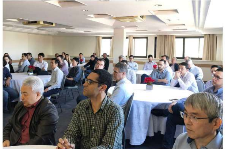
Lideranças do Grupo A.Yoshii durante as reuniões de mentores e mentorados.