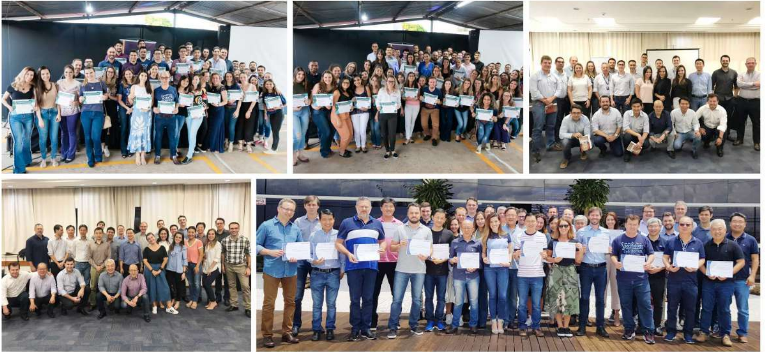
Profissionais de diferentes setores e unidades do Grupo A.Yoshii, durante os cursos e as entregas de certificados em 2019.

engajamento dos colaboradores, tanto dentro quanto fora da sala de aula, mostrando a filosofia presente na empresa. Os treinamentos levam as pessoas ao aprimoramento das condutas e dos processos e a buscar melhorias constantes, o que mantém a Construtora na vanguarda do segmento”.