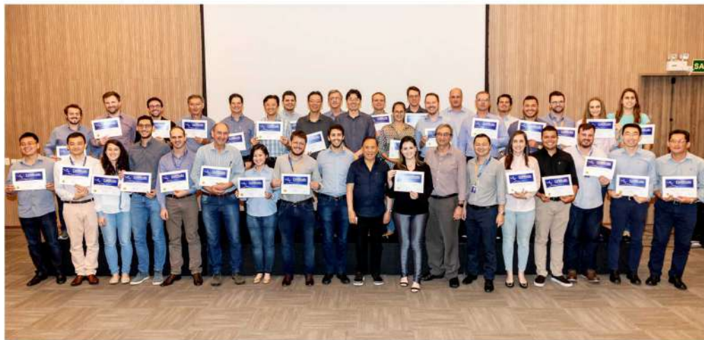
Profissionais do Grupo A.Yoshii encerram capacitação sobre o conceito Lean.

A ADOÇÃO DO CONCEITO LEAN, UMA PRÁTICA MUNDIALMENTE APROVADA GARANTE A OTIMIZAÇÃO DOS RESULTADOS