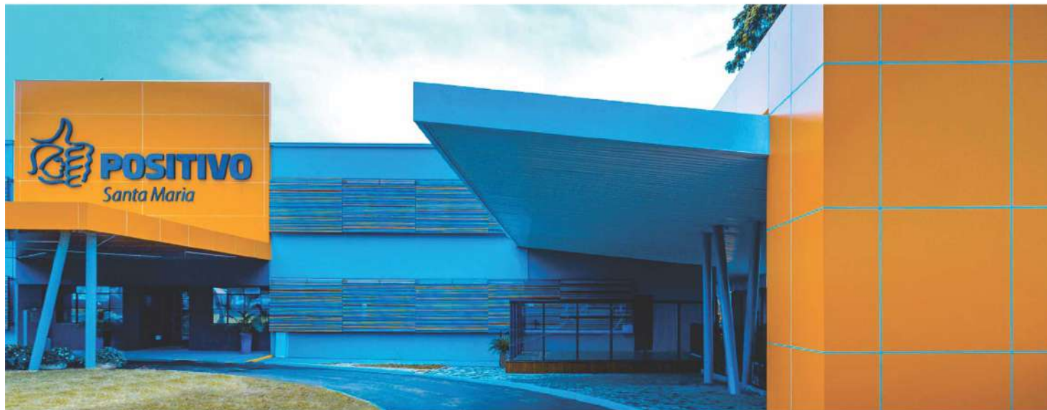
Colégio Positivo – Santa Maria amplia instalações e oferece novo acesso aos alunos, pais e professores.

PROFESSORES E ALUNOS RETORNAM ÀS AULAS E USUFRUEM DE AMBIENTES AMPLOS, MODERNOS E CLIMATIZADOS