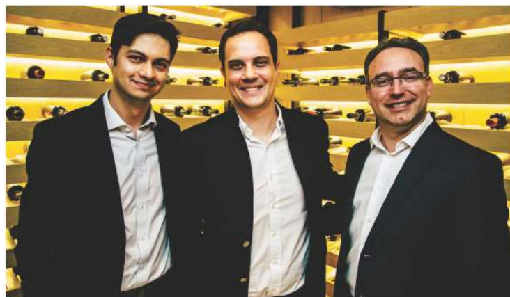
Gestores da A.Yoshii e da Amcham Curitiba.