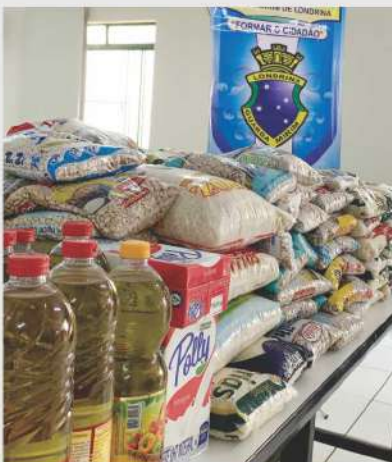
Guarda Mirim recebe 1,5 t de alimentos em 2019.

No balanço do ano, após a realização de outras campanhas de arrecadação de alimentos, o Instituto A.Yoshii distribuiu mais de 2,3 toneladas de mantimentos a essas três instituições, ficando a Guarda Mirim com o total de 1,5 toneladas, a Fundação Isis Bruder com 413 kg e o Pequeno Cotoengo com 355 kg. ■