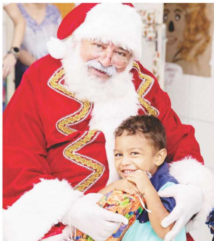
Papai Noel durante a distribuição dos presentes arrecadados pela A.Yoshii.

CLIENTES E COMUNIDADE PARTICIPAM DE CAMPANHAS E DOAM MAIS DE 600 BRINQUEDOS A ENTIDADES CARENTES