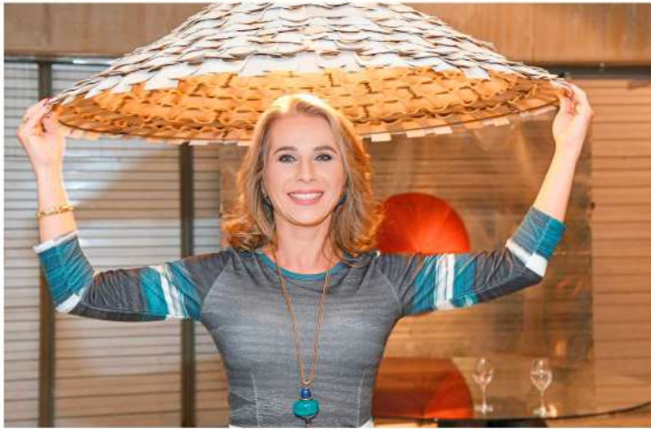
Peças decorativas feitas com resíduos da construção civil.