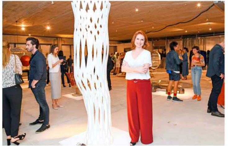
Peças originais mostram a criatividade e o talento dos artistas.