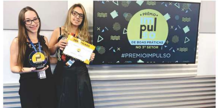
Profissionais do Instituto A.Yoshii.

O Programa Impulso, do Instituto GRPCOM, braço social do Grupo RPC, realizou no final do ano passado o 1º Prêmio Impulso de Boas Práticas no 3º Setor. A premiação teve como principal objetivo a valorização e o reconhecimento das práticas de gestão e comunicação das instituições sociais do Paraná que possuem cadastro e diagnóstico completos no Programa Impulso.