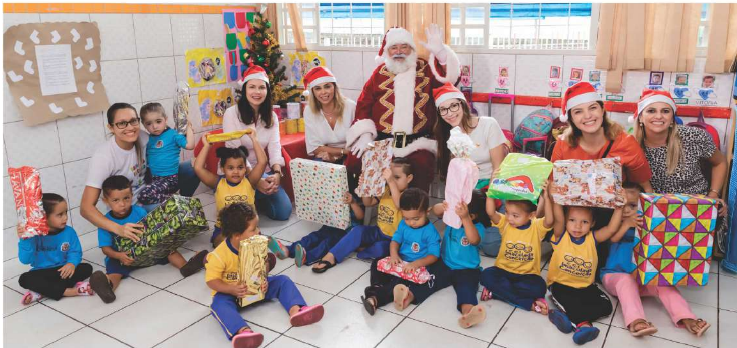
Entrega dos presentes de Natal às creches realizada por voluntários do Instituto A.Yoshii.