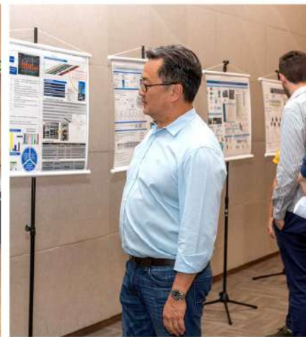
Presidente Leonardo Yoshii, durante a exposição dos Projetos A3 desenvolvidos durante os módulos do Lean.

As equipes de Engenharia, de Incorporação e de Obras Corporativas do Grupo A.Yoshii concluíram cinco módulos de treinamentos ministrados pela Lean Institute Brasil (LIB), totalizando 2500 horas de novos procedimentos e conhecimentos baseados no conceito Lean. Trata-se de uma filosofia de gestão inspirada em práticas e resultados do Sistema Toyota, que visa eliminar desperdícios e resolver problemas de maneira sistemática, repensando a forma de liderar, gerenciar e desenvolver pessoas.