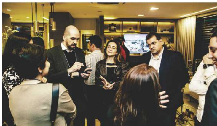
Os convidados participaram de dinâmicas de grupos nos apartamentos decorados.

Durante o evento no showroom, foram realizadas dinâmicas de grupos nos apartamentos decorados – Artsy, La Serena Plaza España e Maison Legend Ecoville –, o que aproximou os convidados e favoreceu a troca de experiências. ■